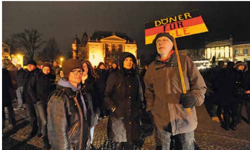
Schwerin, am 12. Januar 2015 · An der Demonstration für Toleranz und eine Willkommenskultur für Flüchtlinge beteiligten sich auch Mitglieder unseres Vereins.