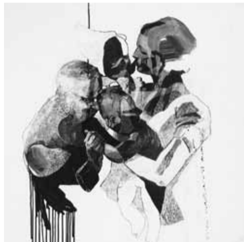
Rando Geschewski · Heinrich, Margarete, Gerhard & Gudrun · Tusche

Die »Burg« wurde als Schule für Kunsthandwerk im Jahr 1915 in Halle an der Saale gegründet. In Gebäuden unterhalb der mittelalterlichen Burg Giebichenstein am Ufer der Saale unterrichteten bedeutende KünstlerInnen und prägten das spezifische Profil dieser Schule – die Verbindung von handwerklich geschulter »Hand« und künstlerisch