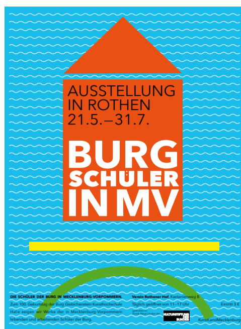
Plakat zur Ausstellung im Rothener Hof

Wir genießen es hier, zurückgezogen leben und arbeiten zu können, doch trotzdem sozial eingebunden zu sein. Meine Liebe zur Natur in ihren vielfälti-